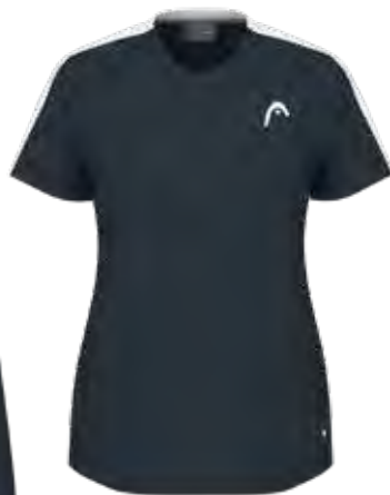
814644 NV (Insert WH)