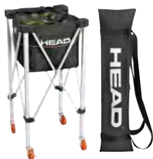
T.I.P. BALL TROLLEY

T.I.P. Be ready with HEAD's T.I.P. products. In Zusammenarbeit mit der „Tennis Play and Stay!“-Kampagne der International Tennis Federation hat HEAD T.I.P. entwickelt, einen einzigartigen Ansatz, der Spielern hilft, das Tennisspielen schneller zu erlernen.