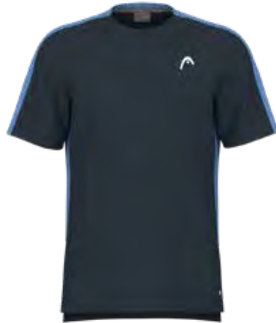
811554 NV (Insert HB)