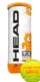
HEAD T.I.P. ORANGE