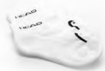
JUNIOR 816131 FARBE WH

PRODUKT EIGENSCHAFTEN Soft-Touch-Komfort-Baumwolle Fersenschoner