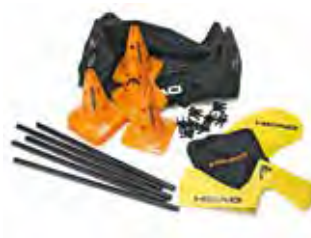
COACHING STARTER PAKET