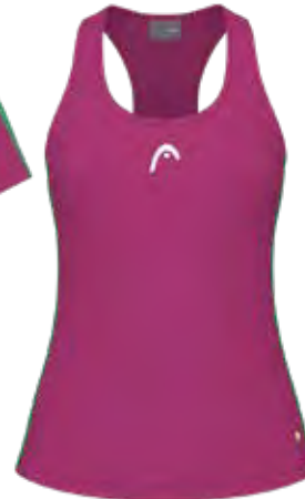
814674 VP (Insert CA)