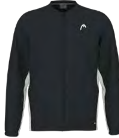
811594 BKWH (Insert WH)