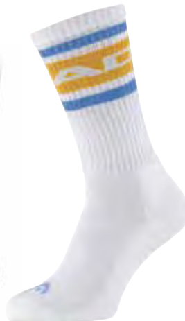
UNI 811543 FARBE BNH

PRODUKT EIGENSCHAFTEN 1x1 Rippenbündchen Baumwolle für weichen Griff und Komfort perfekt geformte Ferse flache Zehennaht