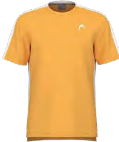
811554 BN (Insert WH)