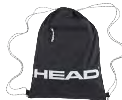
TOUR TEAM GYM SACK