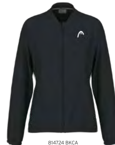
814724 BKCA (Insert CA)