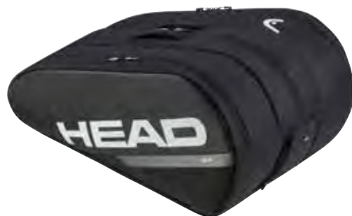
TOUR RACQUET BAG XL