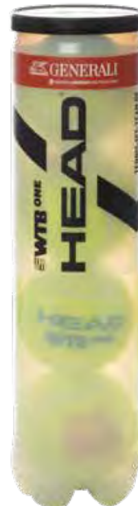
HEAD WTb ONE*