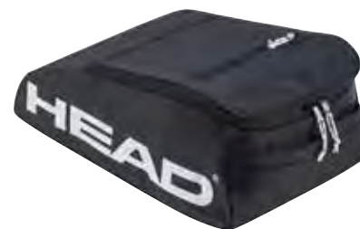
TOUR TEAM SHOE BAG