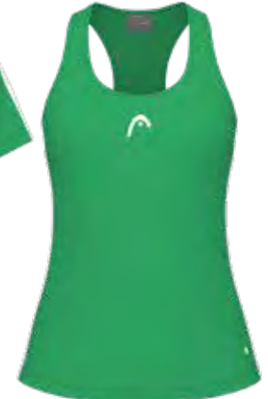
814674 CA (Insert WH)