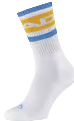
UNI 811533 FARBE BNH

PRODUKT EIGENSCHAFTEN durchgehende Frotteesohle weiche Komfort-Baumwolle