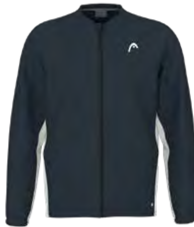
811594 NVWH (Insert WH)