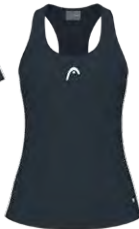
814674 NV (Insert WH)