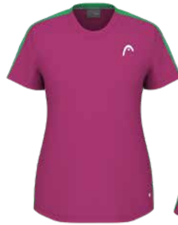
814644 VP (Insert CA)