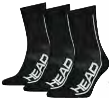
UNI 811904 FARBE BKW