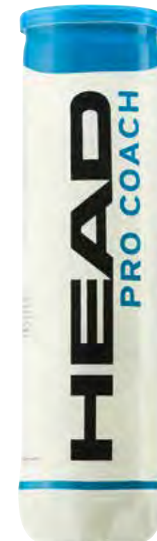
HEAD PRO COACH