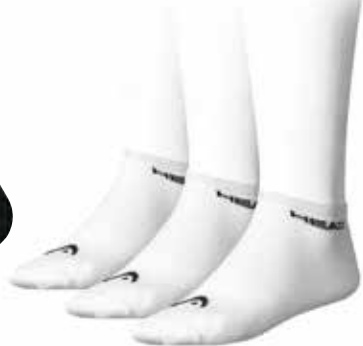
UNI 811934 FARBE WHB

PRODUKT EIGENSCHAFTEN Top mit Komfort technische Polyester/Baumwoll- mischung luftdurchlässig Fußgewölbestütze gepolsterte Socke für Stoßdämpfung