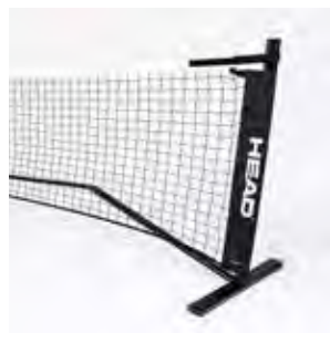
MINI TENNISNETZ 6.10