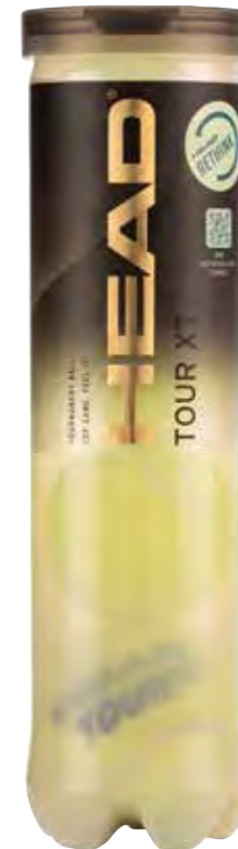
HEAD TOUR XT*