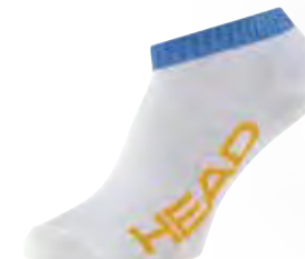
UNI 811523 FARBE BNH

PRODUKT EIGENSCHAFTEN durchgehende Frotteesohle weiche Komfort-Baumwolle