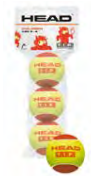
HEAD T.I.P. RED