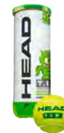
HEAD T.I.P. GRÜN